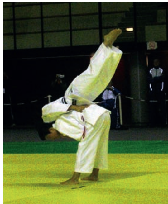
Duo japonais vainqueur en juno kata